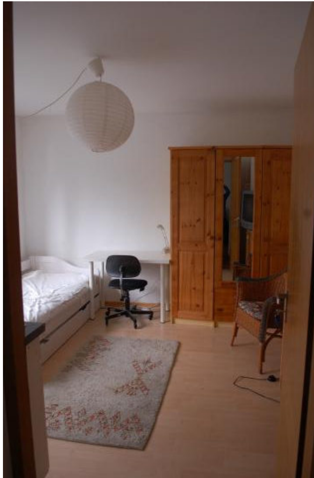
Zimmer von der Eingangstüre

Möbliertes Zimmer mit seperatem Eingang in schöner Wohnlage in Biberach-Rissegg