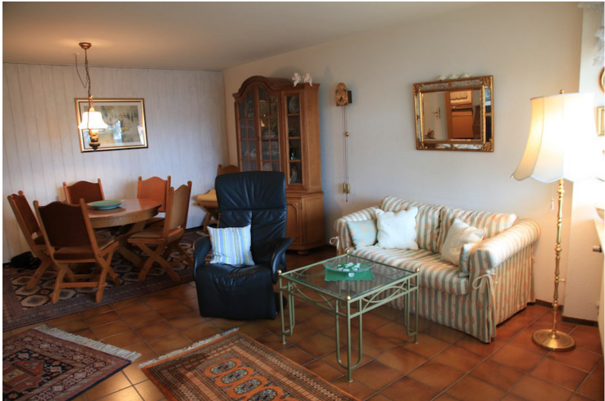
Wohn- und Esszimmer